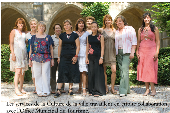
Les services de la Culture de la ville travaillent en étroite collaboration avec l'Office Municipal du Tourisme.

Au constat de l'engouement toujours grandissant et du succès de ce panel culturel, le personnel remplit sa mission : 'Être au service de tous, pour le plaisir de chacun'.