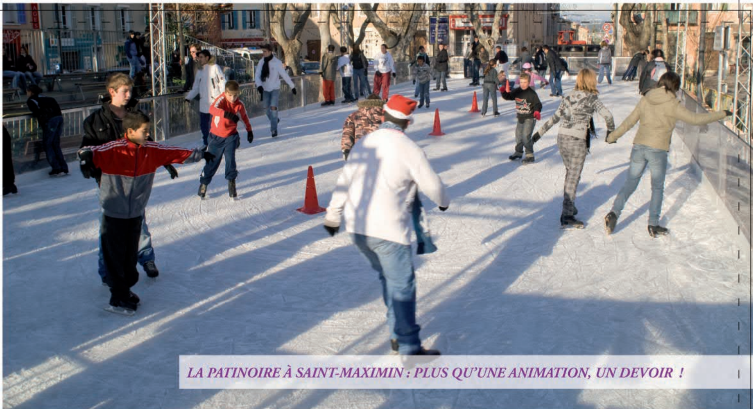
LA PATINOIRE À SAINT-MAXIMIN : PLUS QU'UNE ANIMATION, UN DEVOIR !

Cette année encore, tous les services de la ville se mobilisent autour de cet événement phare qui se déroule en plein cœur de la cité.