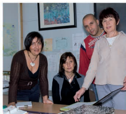
L'équipe des affaires scolaires

Pensez à signaler au service des Affaires Scolaires tout changement de situation de vos enfants (naissance de frères et sœurs, déménagement, apparition d'allergies alimentaires, problèmes de santé, etc.).