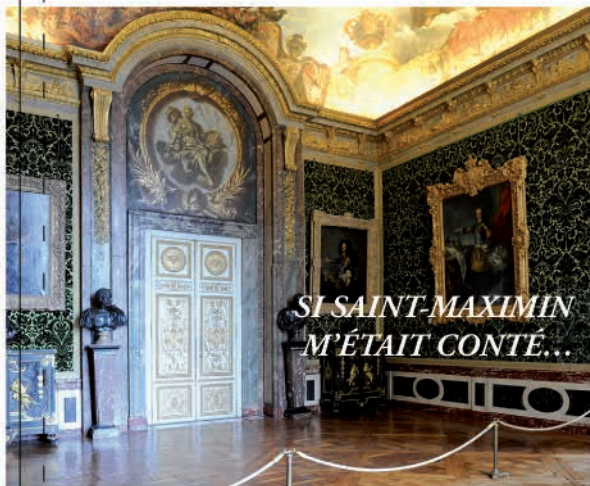
SI SAINT-MAXIMIN M'ÉTAIT CONTÉ...

Saint-Maximin-la-Sainte-Baume rayonne par un patrimoine riche symbolisé par la basilique Sainte-Marie-Madeleine. Mais saviez-vous que notre ville a aussi su exporter ses atouts au-delà de son territoire, et ce jusqu'à trouver grâce aux yeux des rois de France ? Le salon de l'Abondance, au château de Versailles, est décoré de marbres provenant de la carrière saint-maximinoise. Ainsi, même dans la demeure du Roi Soleil, vous trouverez un signe supplémentaire du caractère unique de notre cité.