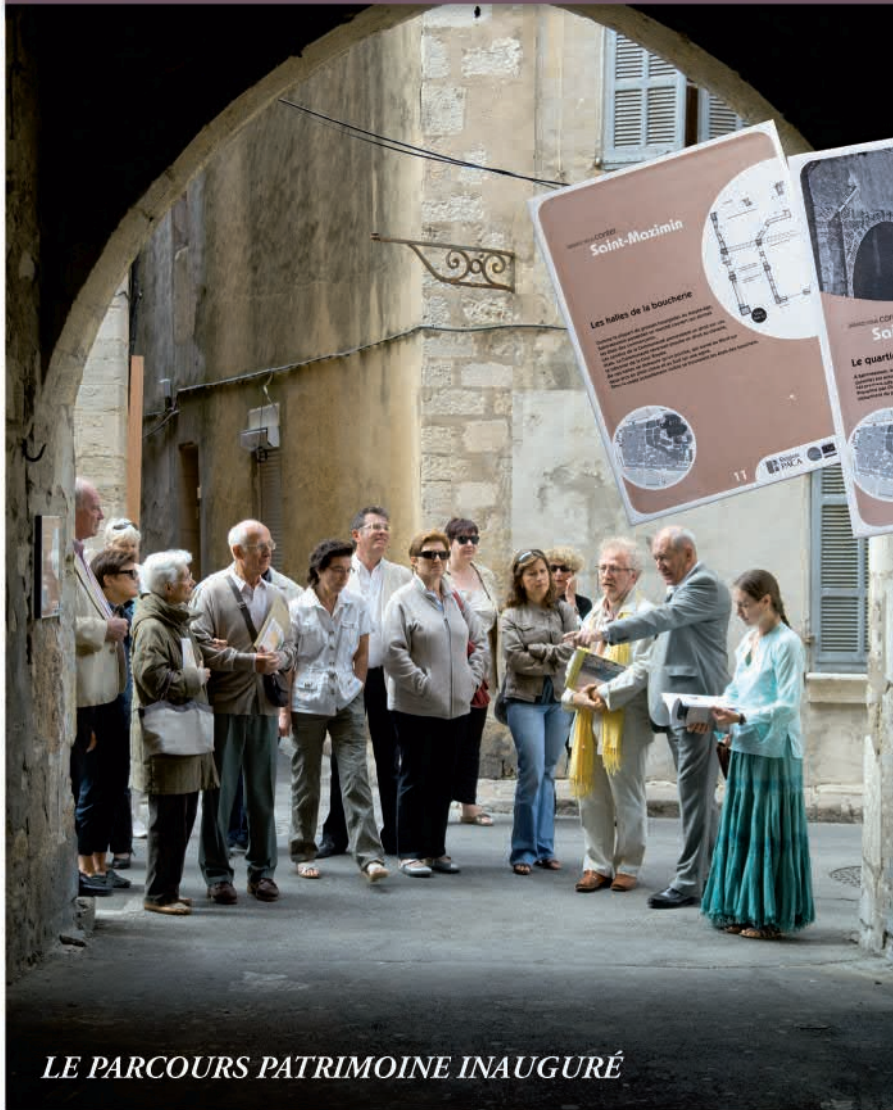
LE PARCOURS PATRIMOINE INAUGURÉ

Le 19 septembre dernier, à l'occasion des Journées Européennes du Patrimoine, Monsieur le Maire a inauguré le Parcours Patrimoine de Saint-Maximin. Les habitants qui ont coutume de passer dans le centre historique ont sans doute pu remarquer l'installation de ces 17 plaques qui signalent des hauts lieux, plus ou moins connus, du patrimoine de la cité. Ces fêtes de fin d'année pourront être l'occasion de faire découvrir la ville autrement aux amis et à la famille, venus en congés dans notre belle région !