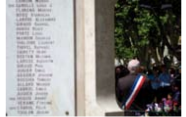
Un devoir de mémoire