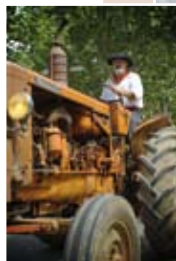
Fêtes de Marie-Madeleine