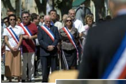
14 juillet : Fête Nationale