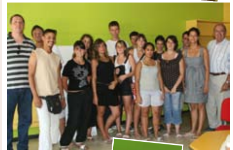
Les chantiers jeunes