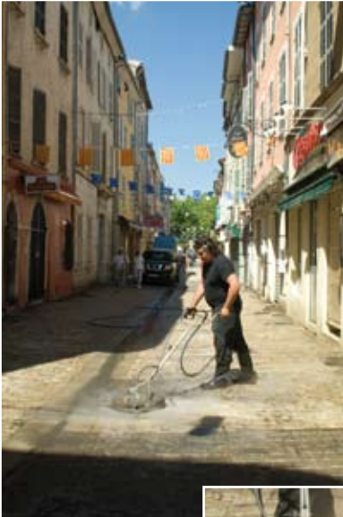
Nettoyage de la rue du Général de Gaulle