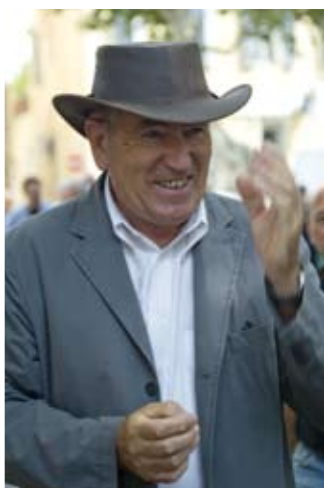
Fête des Moissons