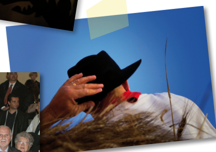
La Fête des Moissons : senteurs et danses, la Provence au cœur de l'été !