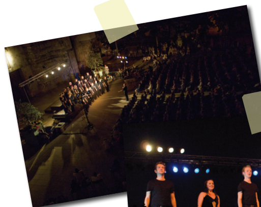
Les 'Celtic Legend' enflamment le jardin de l'Enclos.

Tant d'événements, de rencontres, de fêtes en cette année 2008... Impossible de les évoquer tous en une page ! Retour sur quelques instants de joie ou de recueillement qui marquèrent la ville. Et rendez-vous dans les mois à venir !