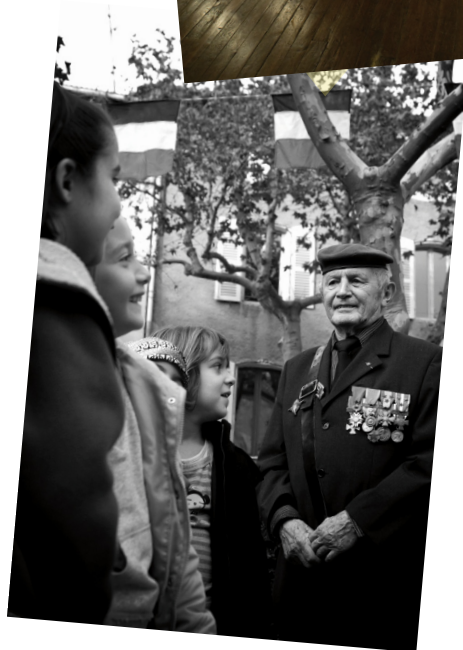
Cérémonies de novembre : le souvenir du passé pour un avenir meilleur.