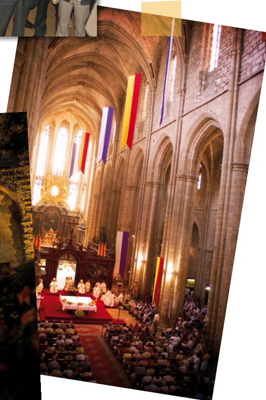
Fête de Marie-Madeleine : l'incontournable rendez-vous.