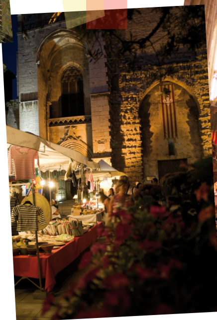
Les marchés de l'été : la ville brille sous les étoiles.