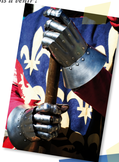
La Fête Médiévale : Saint-Maximin au cœur de l'Histoire...